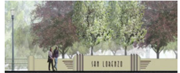
Entrada a la comunidad de San Lorenzo